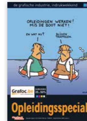
Opleidingsspecial in Grafisch Nieuws, juni 2007

waarin te zien is hoe het boek gedrukt (Drukkerij De Muyter) en afgewerkt wordt (Brepols en Splichal). Alle scholen en andere geïnteresseerden ontvangen gratis de DVD ter promotie van de grafische sector. Later komen er ook nog “het gerecht” en “het product” bij.