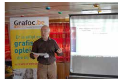
Derde Boatshow in Genk