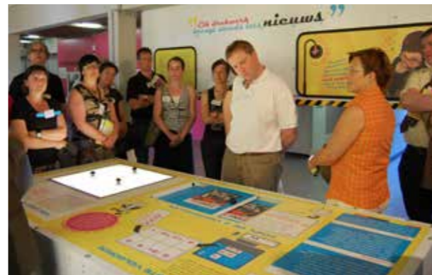
Opening van de drie Ontdekhoeken van de grafische sector

In een latere fase volgt nog de ontwikkeling van een praktische workshop , specifiek voor de printmedia, waarbij jongeren een boekje maken en allerlei opdrachten uitvoeren.