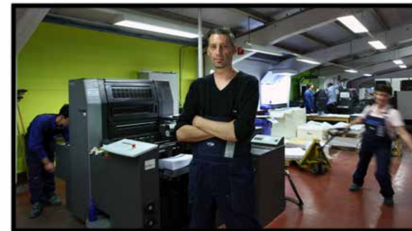
Opleidingscentrum GRAFOC - Syntra West - VDAB

Werkzoekenden worden opgeleid tot drukkers en drukafwerkers, medewerkers uit grafische bedrijven kunnen zich op maat bijscholen. Dit is een aanvulling op de VDAB-opleidingscentra in Haasrode (Leuven) en Turnhout .