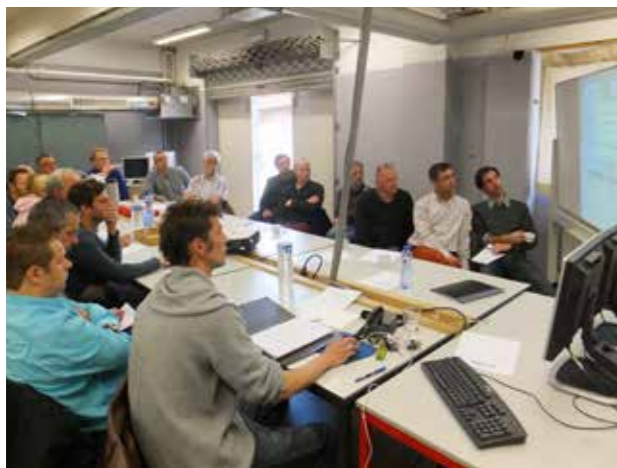
SHOTS-training voor leerkrachten bij Stedelijk Lyceum Cadix

Het ESF-project Werkplekieren wordt goedgekeurd. GRAFOC doet onderzoek bij scholen, VDAB, opleidingscentra, vakbonden en bedrijven aan wat een kwalitatieve stageplaats moet voldoen. Dit onderzoek resulteert in een website met erkende stagebedrijven onder de naam PrintmediaStages.be .