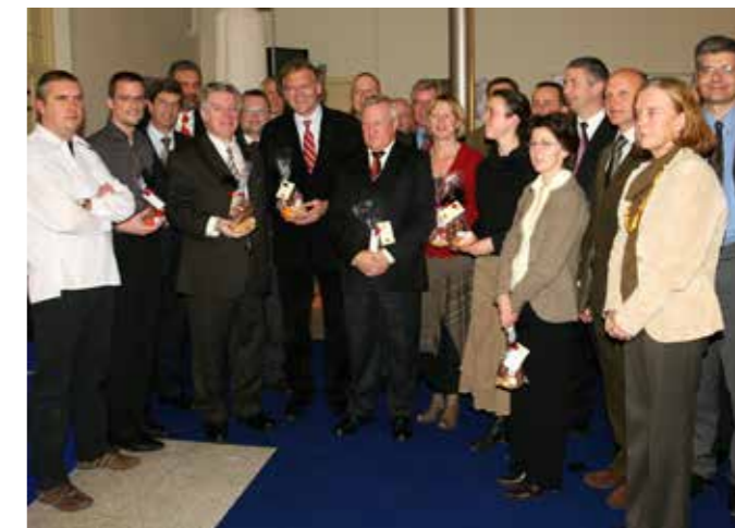
6 december 2006, opening van het project Druk en afwerking in Heule.

We ondersteunen financieel de onderwijs promotie-campagne " Pet af voor technische vorming " van RTC West-Vlaanderen .