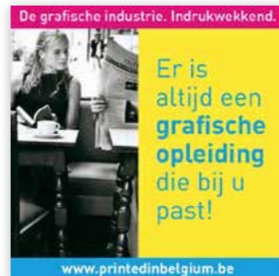
Promocampagne “Er is altijd een grafische opleiding die bij u past”

Op initiatief van de Meetjeslandse Leerwerkbedrijven (MLWB) starten we opnieuw een opleidingstraject om werkzoekenden op te leiden tot drukafwerker in de regio Meetjesland (Gent-Eeklo). De partners zijn VDAB Gent (selectie van cursisten), MLWB (project verantwoordelijke) en GRAFOC (opleidingsadvies, netwerk en marktonderzoek binnen de regio). De cursisten ( langdurige werkzoekenden ) kregen 191 uren opleiding tot Drukafwerker (inclusief twee bedrijfsbezoeken ), gevolgd