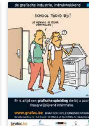
Een van de vier affiches

GRAFOC lanceert vier affiches met cartoons van cartoonist Aaargh die aandacht creëren rond het belang van goed opgeleide medewerkers . O.a. alle grafische bedrijven ontvangen hun set affiches om te verspreiden en te sensibiliseren.