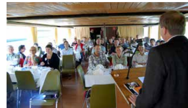
Tweede Bootshow in Gent

De regelmatige contacten met onze Nederlandse GOC-collega's leiden in 2011 tot een samenwerkingsovereenkomst om op regelmatige basis kennis en ervaring uit te wisselen.