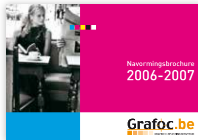
Cover van de nieuwe Navormingsbrochure

De eerste “ Navormingsbrochure 2006-2007 ” wordt gedrukt en ruim verspreid. Trotse portretten van arbeiders en werkgevers van fotograaf Filip Naudts zorgen voor een sterk geheel. De infobrochure bevat een overzicht van onze diensten en alle grafische volwassenen opleidingen in Vlaanderen.