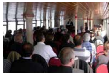
Diverse presentaties tijdens de 1e GRAFOC Bootshow

Knelpuntberoepen: In het voorjaar van 2007 brengt GRAFOC op vraag van de sector verschillende partners bij elkaar (RTC, VDAB, KTA Heule) om in West-Vlaanderen werkzoekenden op te leiden tot drukafwerker . 100 werkzoekenden worden aangeschreven, 46 komen naar de infosessie, acht kandidaten starten het