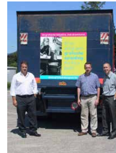
Promotie voor de grafische sector, beroepen en onderwijs i.s.m. Epacar

bijgevolg te zien op snelwegen en in steden en gemeenten. Epacar was bereid om de laadkleppen van deze vrachtwagens gedurende twee maand te voorzien van het campagnebeeld.